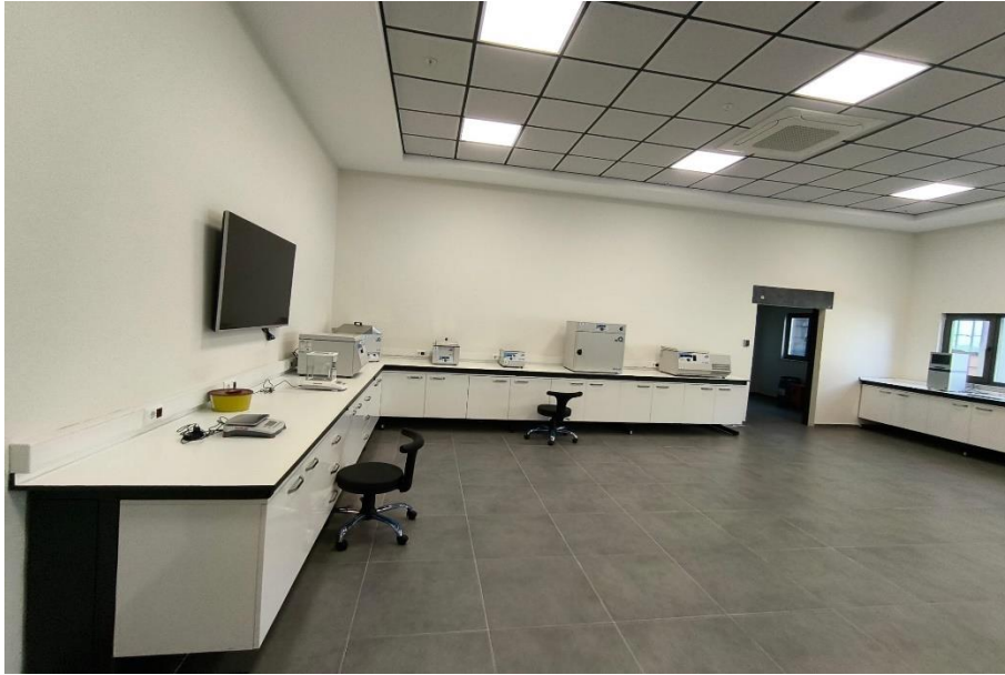
Kanıt 10: Arařtırma Laboratuvarı

Tüm tıp fakültesi öğrenci ve arařtırmacılarının ileri düzey arařtırmalarını gerekleřtirebilmesi için fakültemiz bünyesinde her biri ayrı ayrı olmak üzere kirli, yarı steril ve steril alana sahip 2 adet Arařtırma laboratuvarı mevcuttur. (Kanıt 10)