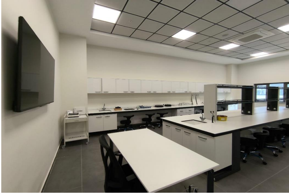
Kanıt 4: Multidisipliner Laboratuvar IV

Fakültemizde ayrıca Anatomi Anabilim Dalı altyapısında kullanılmak üzere, 1 adet kuru maket laboratuvarı (Kanıt 5), 1 adet Diseksiyon laboratuvarı (Kanıt 6), 1 adet Kadavra Saklama Ünitesi (Kanıt 7) ve 1 adet Bireysel çalışma alanı bulunmaktadır.