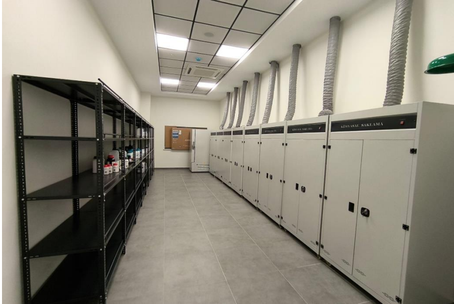
Kanıt 8: Kimyasal Depolama Ünitesi

Altyapımız tesis edilirken 6331 Sayılı İş Sağlığı ve Güvenliği Kanunu kapsamında kimyasallar dolayısıyla; dökülme, saçılma ve parlamalardan korunmak amacıyla yüksek güvenli ve izole hava akımına sahip 1 adet kimyasal depolama ünitesi (Kanıt 8) ve 1 adet sterilizasyon ünitesi (Kanıt 9) tesis edilmiştir.