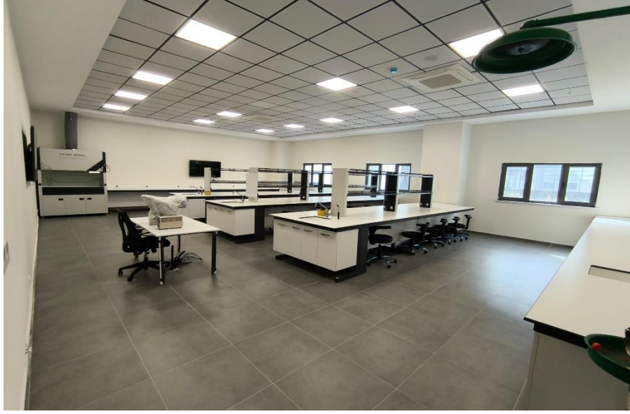
Kanıt 1: Multidisipliner Laboratuvar I