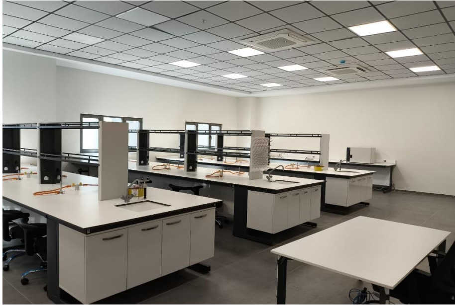
Kanıt 2: Multidisipliner Laboratuvar II