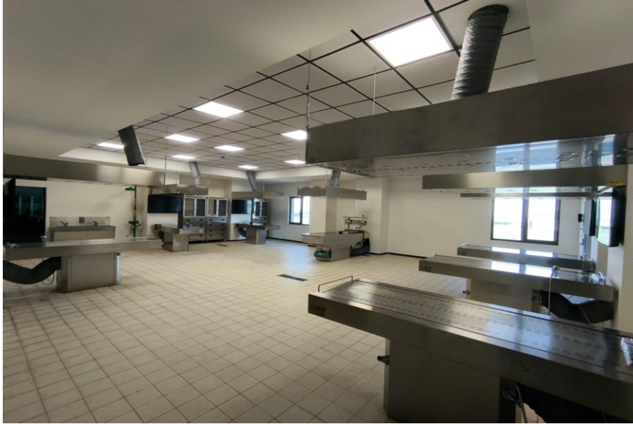
Kanıt 6: Diseksiyon Laboratuvarı