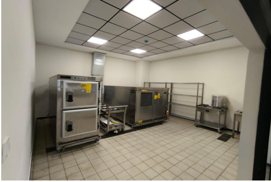
Kanıt 7: Kadavra Saklama Ünitesi

Altyapımız tesis edilirken 6331 Sayılı İş Sağlığı ve Güvenliği Kanunu kapsamında kimyasallar dolayısıyla; dökülme, saçılma ve parlamalardan korunmak amacıyla yüksek güvenli ve izole hava akımına sahip 1 adet kimyasal depolama ünitesi (Kanıt 8) ve 1 adet sterilizasyon ünitesi (Kanıt 9) tesis edilmiştir.