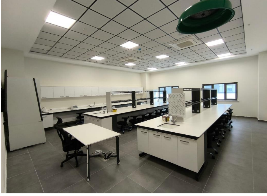
Kanıt 3: Multidisipliner Laboratuvar III